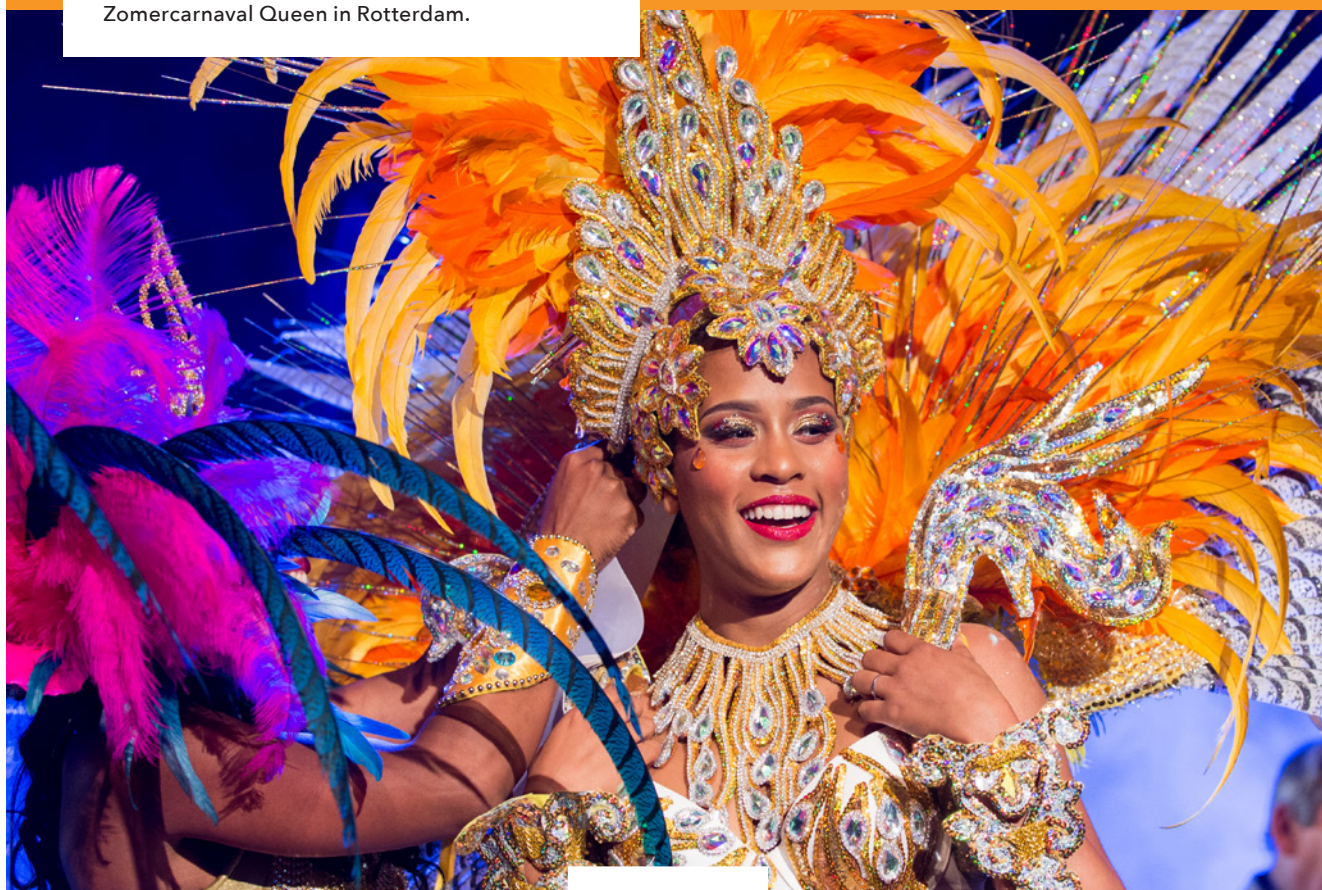
Zomercarnaval Queen in Rotterdam.