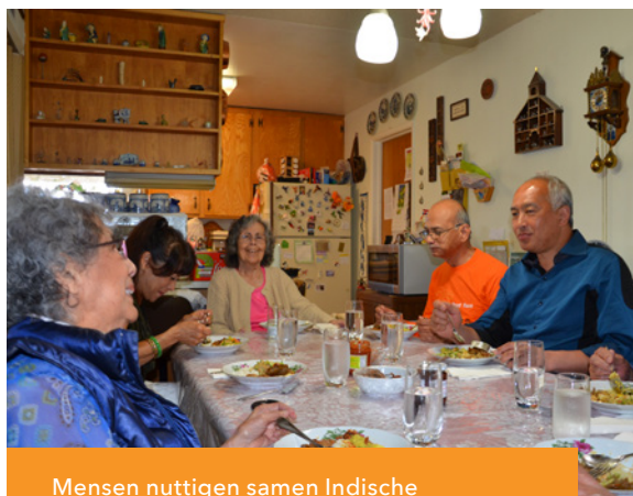
Mensen nuttigen samen Indische rijsttafel gerechten.

Een bijschrijving die veel los maakte 'Indisch koken en de Indische rijsttafeltraditie' is in november 2022 in de Inventaris bijgeschreven door Stichting Indisch Erfgoed. Hierop volgden uiteenlopende reacties vanuit de samenleving: sommige Indische groepen in Nederland ervoeren het als iets positiefs, namelijk dat de bijschrijving onderstreepte dat ook zij onderdeel zijn van de Nederlandse samenleving. Vanuit Indonesisch oogpunt kwam juist kritiek. Deze groep mensen legde de bijschrijving