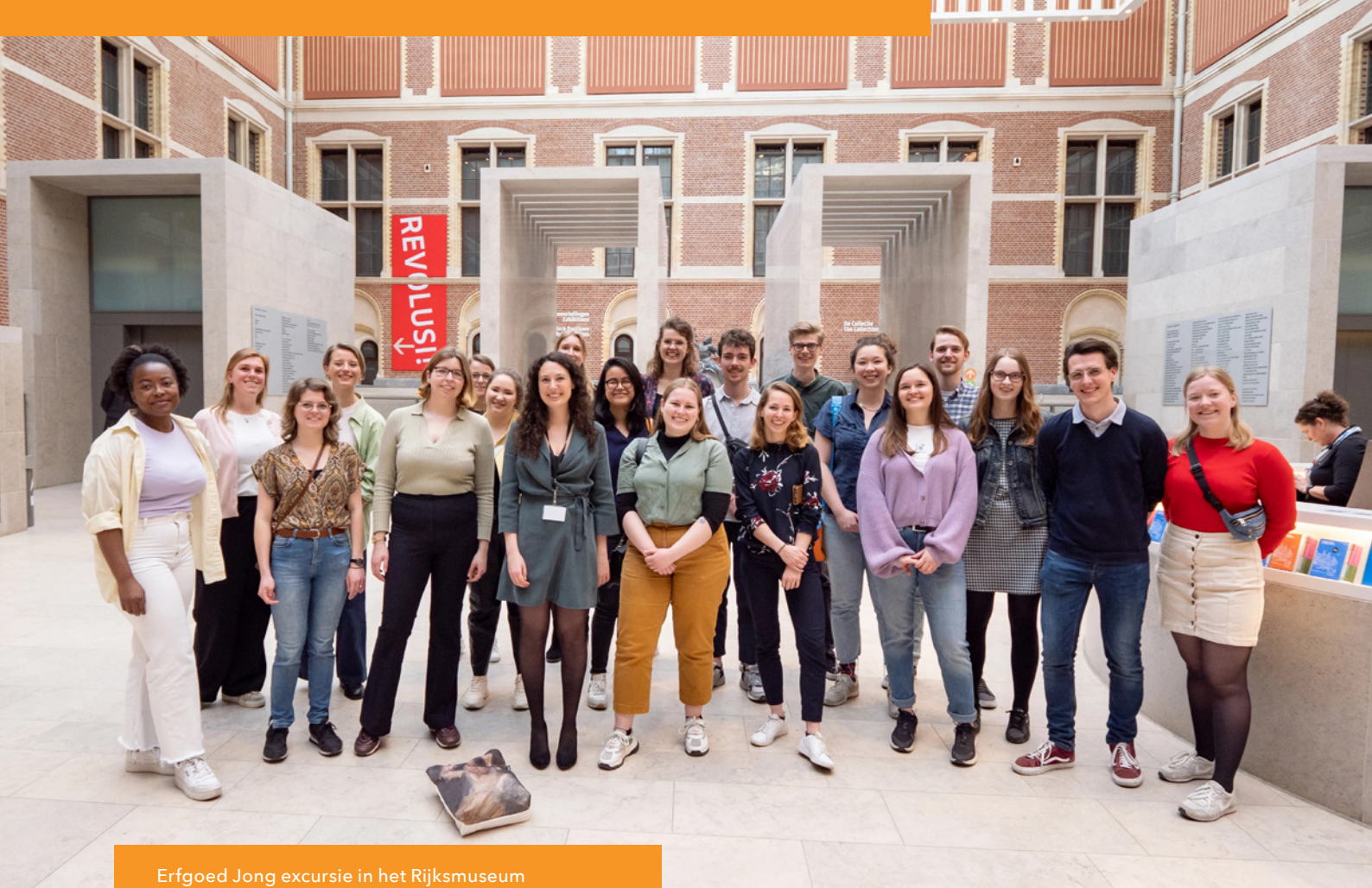
Erfgoed Jong excursie in het Rijksmuseum Amsterdam, foto: Simone Both.