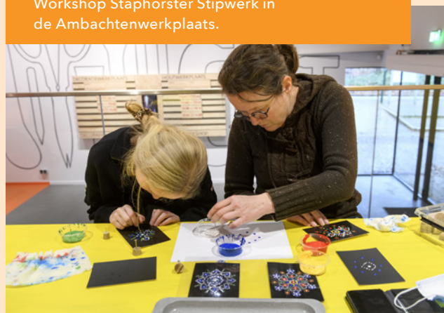
Workshop Staphorster Stipwerk in de Ambachtenwerkplaats.

Sinds de realisatie van de Ambachtenwerkplaats in 2022 kunnen museumbezoekers zelf ervaring opdoen met ambachtelijke technieken. Er zijn twee ruimtes: de Houtwerkplaats en de Decoratiewerkplaats. In 2023 zijn hier workshop-pilots georganiseerd voor de ambachten houtsnijwerk, borduren en diverse manieren van stoffen bedrukken. In de Ambachtenwerkplaats is ook een expositie te zien over hedendaagse makers die vertellen over hun ambacht en de waarde ervan voor de samenleving anno nu. Voor de programmaontwikkeling van de Ambachtenwerkplaats wordt door het KIEN samengewerkt met de afdeling educatie/ conceptontwikkeling en de wetenschappelijke staf van het museum. Hierbij zoeken we actief de samenwerking met MBO en HBO en met immaterieel erfgoedgemeenschappen.