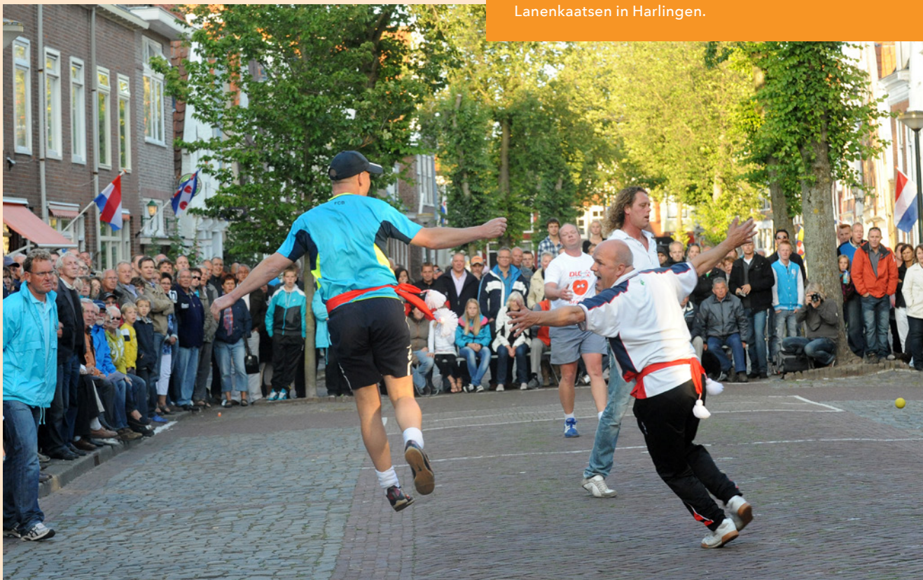
Lanenkaatsen in Harlingen.

De jaarrekening van KIEN wordt sinds 2018 opgenomen in het jaarverslag van het Nederlands Openluchtmuseum. Voor financiële verantwoording wordt daar naar verwezen. Het jaarverslag en de jaarrekening zijn te vinden op www.openluchtmuseum.nl .