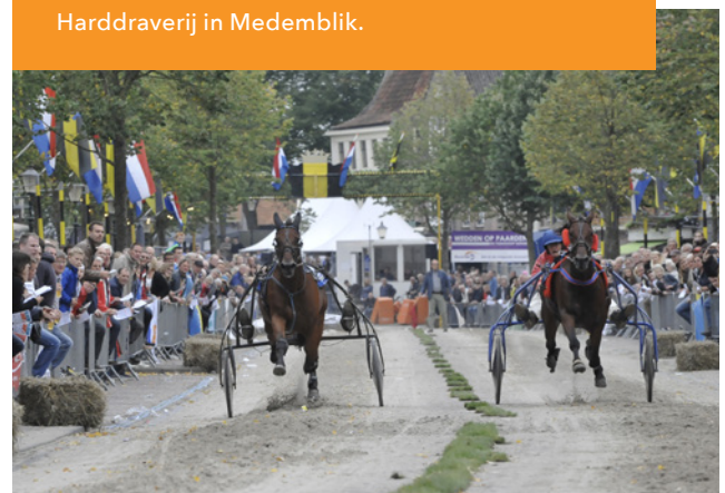
Harddraverij in Medemblik.

KIEN heeft de afgelopen jaren meerdere films laten maken over immaterieel erfgoed. Op deze manier wordt het erfgoed gedocumenteerd en wordt gewerkt aan meer bewustwording. In 2023 zijn er korte films gemaakt over Carbidschieten in Drenthe en over Kortebaandraverijen. Er zijn verschillende kortebaan- en harddraverijen bijgeschreven in de Inventaris en het Netwerk, en in de film komen meerdere locaties en aspecten van de kortebaandraverij aan bod. De films bieden een blik in de keuken van het immaterieel erfgoed: Wat betekent immaterieel erfgoed in een gemeenschap?