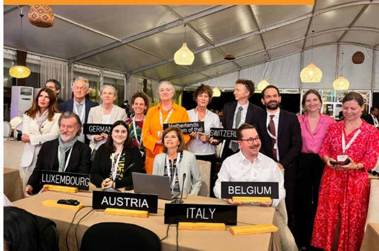
Momentopname tijdens de internationale bijschrijving van Graslandbevloeiing.

KIEN nam deel aan het reguliere coördinatoren-overleg met de andere uitvoeringspartners. In