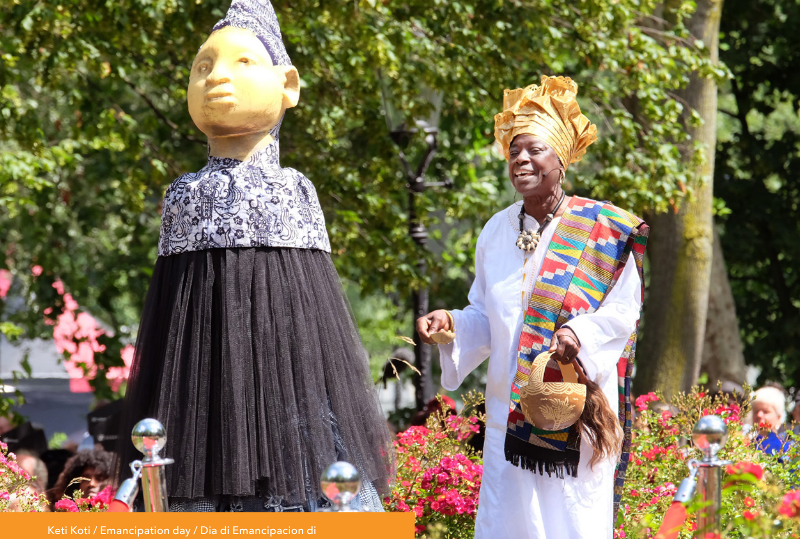
Keti Koti / Emancipation day / Dia di Emancipacion di sclavitud / Dia di Emansipashon, foto: Jean van Lingen.