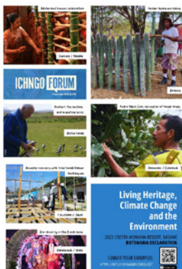
Poster bij de presentatie van de Working group in Botswana, met voorbeelden van o.a. het trekvogel onderzoek in Nederland en de cactusheggen op Bonaire.

In 2023 heeft KIEN, als bij UNESCO geaccrediteerde ngo, op verschillende momenten input geleverd. Zo werd de werkgroep Living Heritage and Climate Change and the Environment opgericht, waarin KIEN een actieve deelnemer is. De werkgroep onderzoekt de relatie tussen immaterieel erfgoed en klimaatverandering c.q. (verlies van) biodiversiteit. Zowel het gevaar van verlies van immaterieel erfgoed, als juist de rol van immaterieel erfgoed als hefboom voor een biodivers en klimaatrobuust landschap komt aan de orde. Deze thema's worden uitgediept via seminars (zowel digitaal als tijdens de Unesco-conferenties), en worden uiteindelijk gepubliceerd in een bundel. De looptijd van de werkgroep is twee jaar.