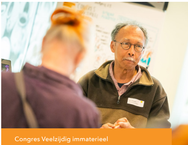
Congres Veelzijdig immaterieel erfgoed

Sinds 2015 heeft de Provincie Overijssel immaterieel erfgoed hoog op de agenda staan. Voor de periode 2023-2024 ontvangt KIEN opnieuw subsidie van de Provincie Overijssel voor het zichtbaar maken en versterken van immaterieel erfgoed in de provincie. We hebben een lokale partner aangetrokken om de werkzaamheden van KIEN in Overijssel te coördineren. KIEN werkte ook dit jaar aan deskundigheidsbevordering in Overijssel. Zo werden er op 8 & 9 februari workshops gegeven over immaterieel erfgoed en educatie, specifiek gericht op inwoners van de Provincie Overijssel.