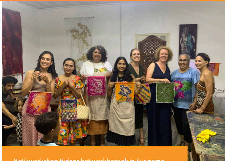
Batikworkshop tijdens het werkbezoek in Suriname.

KIEN heeft, samen met het Openluchtmuseum, in augustus een werkbezoek gebracht aan Suriname. Het doel van het bezoek was voor KIEN tweeledig: enerzijds een verkenning of de Anton de Kom tentoonstelling, die in 2023 in het Nederlands Openluchtmuseum te zien was, in 2024 naar Suriname kan worden overgeplaatst, of kennis en onderdelen van de tentoonstelling daar te delen of te hergebruiken zijn, afgestemd op de Surinaamse bezoeker. KIEN wil hierbij, in samenwerking met lokale partners, immaterieel erfgoed van de verschillende Surinaamse gemeenschappen een plek geven. Het tweede doel van het werkbezoek van KIEN was gericht op nadere kennismaking