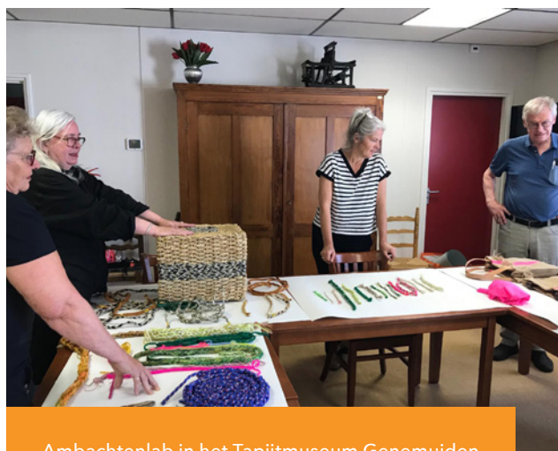
Ambachtenlab in het Tapijtmuseum Genemuiden.