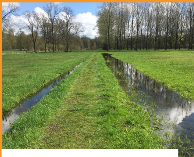
Een bevloed perceel.

Zomercarnaval Rotterdam en Traditionele bevloeiing van grasland kwamen beide op de 'Representatieve Lijst van Immaterieel Cultureel Erfgoed van de Mensheid' van Unesco. Dat werd besloten tijdens de jaarlijkse bijeenkomst van het comité van het Unesco verdrag immaterieel erfgoed in Botswana. Het doel van de representatieve lijst is het beter zichtbaar maken van de wereldwijde diversiteit van immaterieel erfgoed, om zo het besef van het belang en de betekenis van immaterieel erfgoed in het algemeen te bevorderen.