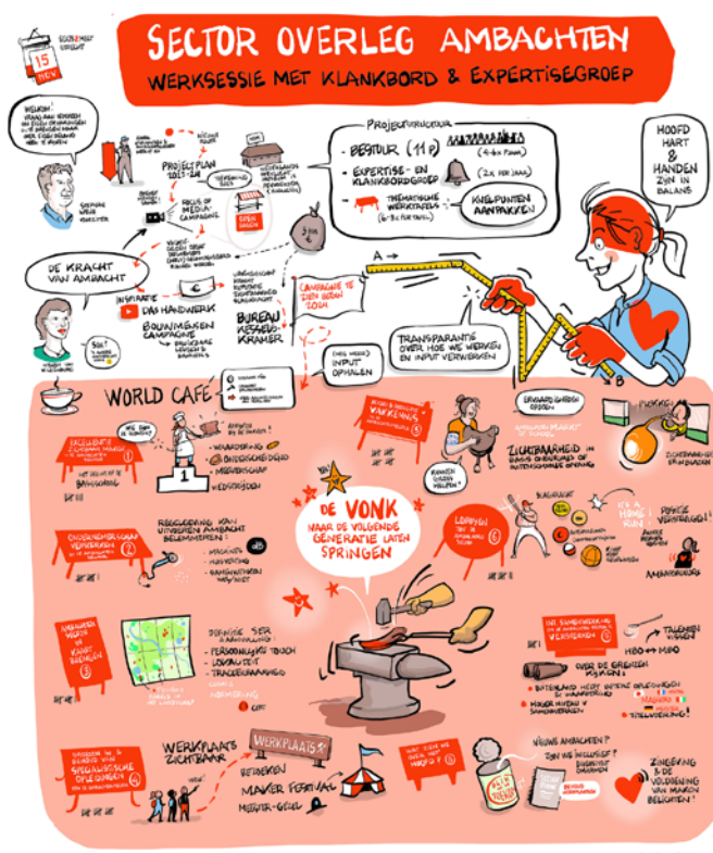
Uitkomst van één van de werksessies die mogelijke oplossingsrichtingen t.b.v. de gehele ambachtensector in kaart brengt.

Het Sector Overleg Ambachten is na ontvangst van de beschikking in september 2023, in oktober 2023 met een reeks activiteiten van start gegaan waarin wordt beoogd de