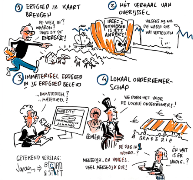
Getekend verslag van het Congres Veelzijdig immaterieel erfgoed door Jeroen Steehouwer.