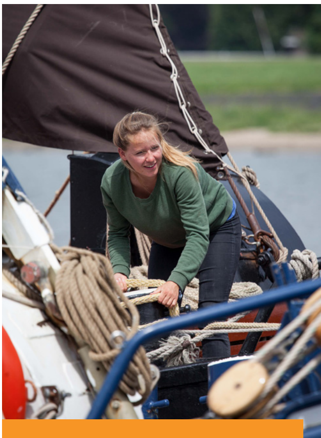
Werken op het voordek van een zeilschip.

Immaterieel erfgoed wordt in Nederland zichtbaar gemaakt door middel van drie kringen: Netwerk Immaterieel Erfgoed, Inventaris Immaterieel Erfgoed Nederland en het Register van Inspirerende Voorbeelden van Borging.